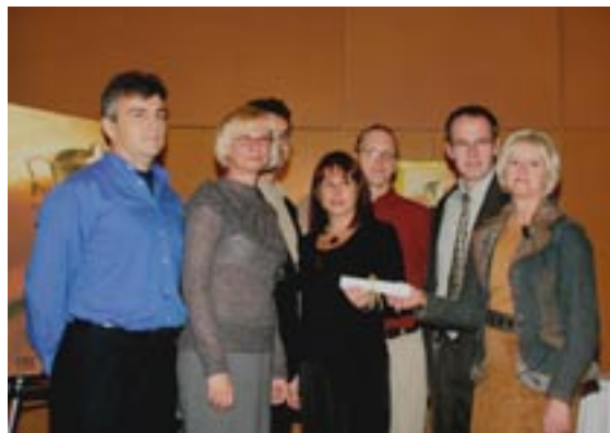
Membres de l'équipe 222 recevant le prix innovation de la CSST, Longueuil, le 7 novembre 2006

En novembre dernier, l'école secondaire De Mortagne de Boucherville a remporté les Lauréats pour le prix innovation en santé et sécurité au travail 2006. Cette dernière a reçu le prix régional dans la catégorie entreprise publique et le projet sera présenté à la finale provinciale au printemps prochain. C'est avec beaucoup de fierté que l'équipe du code 222 réalise que son initiative porte fruit.