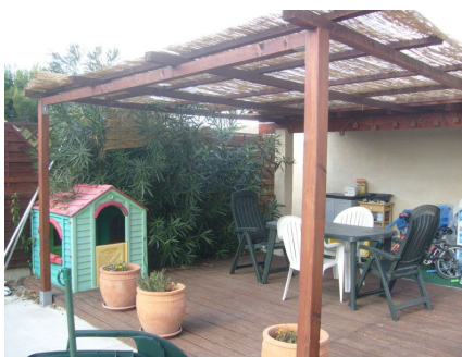
La terrasse en bois dans le jardin