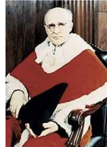
Ivan Cleveland Rand 1884-1969

Prélèvement automatique à la paie pour tous les salariés bénéficiant de la convention collective.