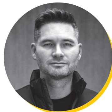
MANU MILITARI PARRAIN DU CONCOURS

Tous les efforts seront déployés pour faire de cette activité d'envergure nationale un succès encore plus grand, grâce au dynamisme des 36 organisations syndicales et des nombreux enseignants et enseignantes qui s'y impliquent partout au Québec.