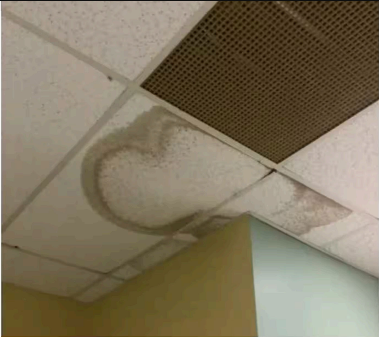
Traces d'infiltration d'eau dans le plafond d'un local de l'école Notre-Dame-de-la-Paix, à Beauharnois, en 2024